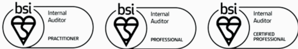
< BSI 트러스트 마크 >

BSI 트러스트 마크는 귀하의 전문성에 대한 확신을 갖게 됩니다. 이력서 뿐만 아니라 명함, 이메일 서명 또는 LinkedIn 프로필에 BSI 자격 마크를 사용하여 귀하의 전문 자격을 성공으로 홍보하세요!